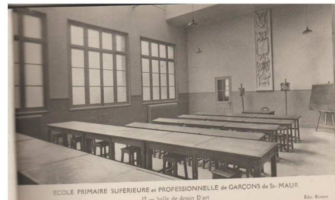
Salle de dessin d'Art 1930