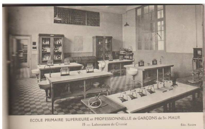
Laboratoire de chimie 1930