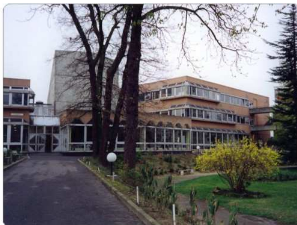
Lycée D'Arsonval, Bâtiment Galilée

Le château du lycée fut construit vers 1835-1850 par Thomas-Louis Cattaert, un orfèvre fabricant de cristaux, de bronzes et tailleur de cristal qui serait à l'origine du nom de la rue des bijoutiers (actuelle rue André Bollier).