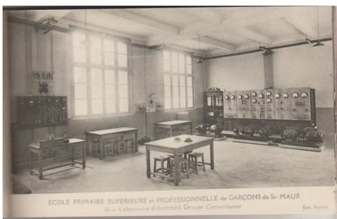
Laboratoire d'électricité 1930