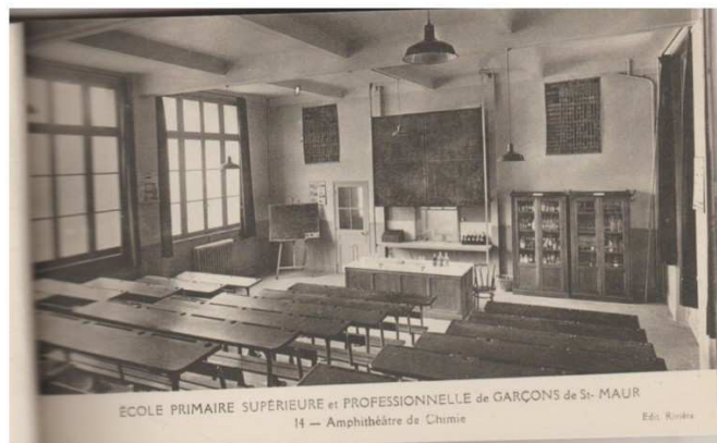
Amphithéâtre de Chimie 1930