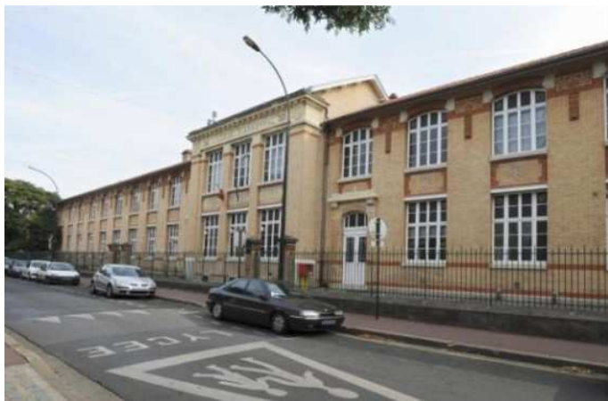
Lycée D'Arsonval, Bâtiment Bollier

Il se compose de 5 bâtiments : les bâtiments Galilée, Bollier, Ader, le préfabriqué ainsi que le bâtiment administratif.