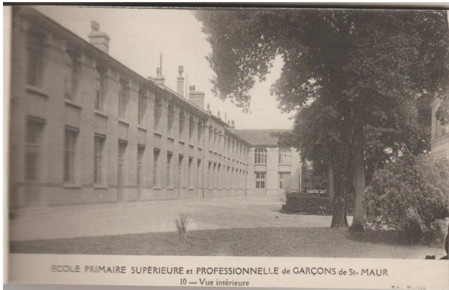
Vue intérieure 1930